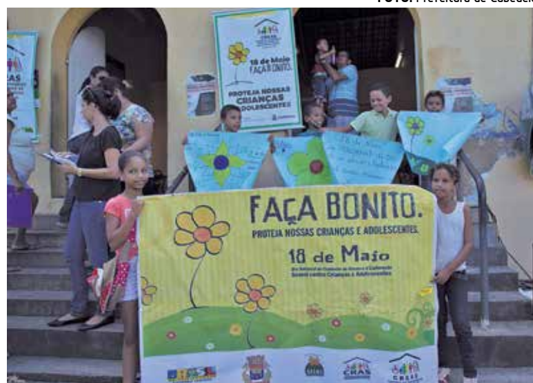
Em Cabedelo, atividades aconteceram na Estação Ferroviária

No dia nacional de combate à exploração sexual infantojuvenil, o Governo do Estado, a PRF e prefeituras fazem um alerta à população. PÁGINA 5