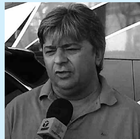
Aldeone, do Sousa, ainda acreditando

serão derrotados na instância nacional. Infelizmente atrapalha quem está na disputa, onde altera tudo, predicando todos", disse.