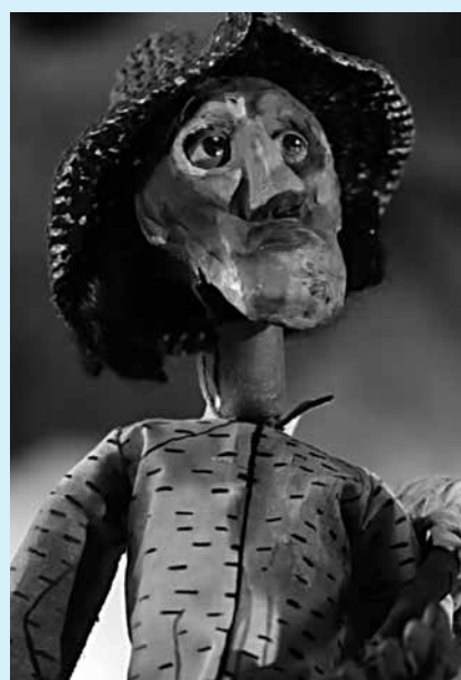
Filme “Retirantes”, de Maira Coelho

Seu nascimento se deu em plena efervescência da produção e difusão do audiovisual no Sertão do Estado. Essa efervescência se deve, principalmente, pelas atividades realizadas por Pontos de Cultura, Cineclubes, pelo Centro Cultural Banco do Nordeste, entre outros, que vem propiciando