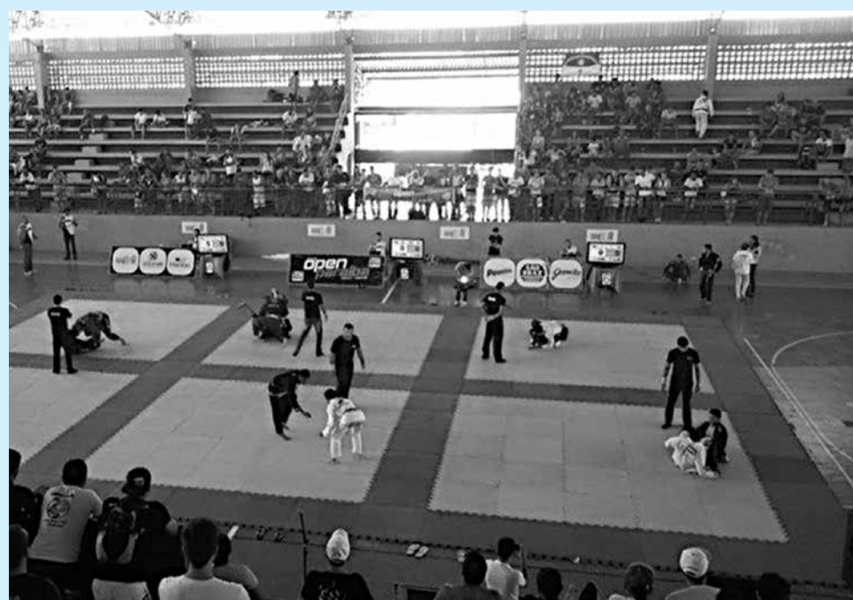
As lutas marciais ocorrerão no Ginásio de Esportes do Centro Universitário de JP

A estrutura do campeonato conta com o apoio da Polícia Militar e Corpo de Bombeiros que se farão presente ao evento garantindo o bem-estar dos atletas participantes. Em todas as edições, o evento seguiu as normas técnicas e de segurança, estabelecidas no Livro de Regras da Confederação Brasileira de Jiu-Jitsu (CBJJ).