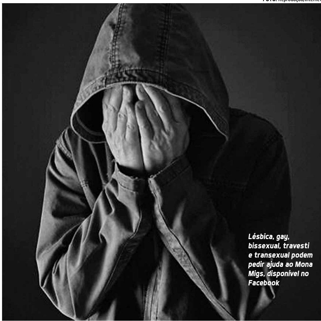
Lésbica, gay, bissexual, travesti e transexual podem pedir ajuda ao Mona Migs, disponível no Facebook

Estudantes da Universidade Federal de Pernambuco criaram o Mona Migs que dá assistência ao público LGBT