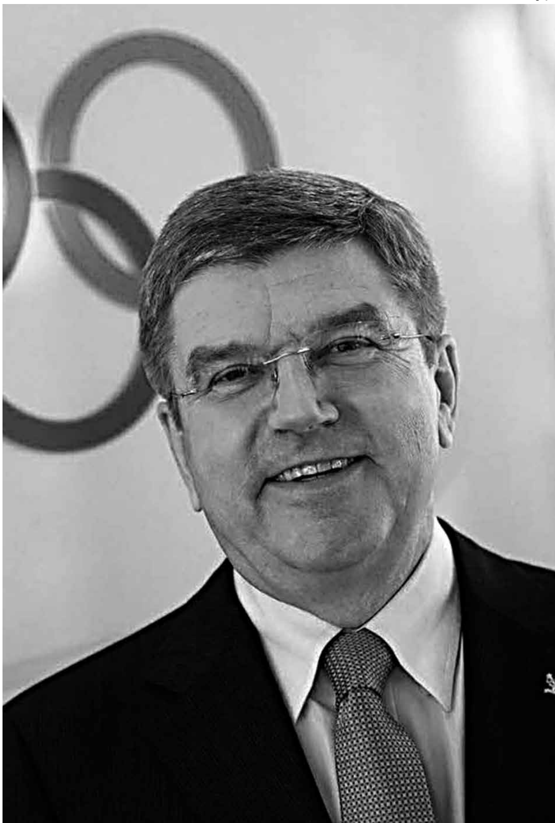
Thomas Bach, presidente do COI, disse que testes foram focados em atletas com potencial

Os testes foram focados em atletas com potencial para disputar os Jogos de 2016, e ainda não terminaram. O comitê avisou que mais 250 resultados, desta vez usando amostras de Londres-2012, devem ser divulgados nos próximos dias. Além disso, medalhistas de Londres e Pequim devem ser reexaminados de forma mais minuciosa.