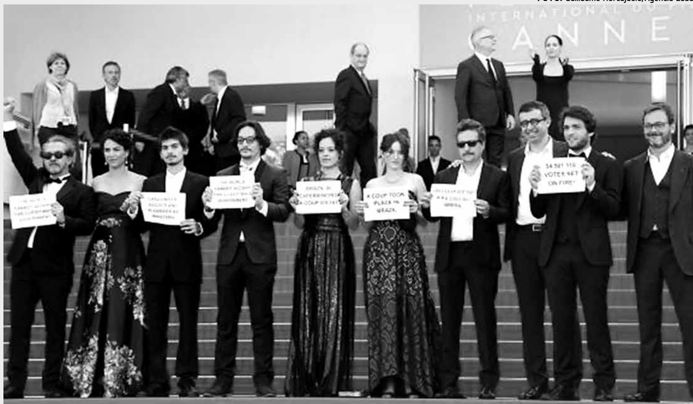
Equipe do filme Aquarius, dirigido pelo brasileiro Kleber Mendonça, protesta no tapete vermelho do Festival de Cinema de Cannes

Ao persistir ontem no seu elogio à governabilidade enquanto ponte ao bem comum, o governador Ricardo evocou a trajetória das buscas pela democracia, seus agentes provocadores, suas transformações e meios de realização. Um momento pleno de política. Sublime e banal.