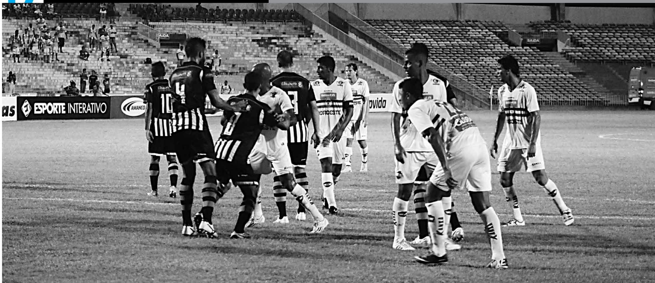
No primeiro confronto, na semana passada, em Teresina, no Piauí, o time paraibano se saiu melhor, venceu por 1 a 0 e faz o jogo de volta, hoje, no Estádio Almeidão, precisando apenas de um empate