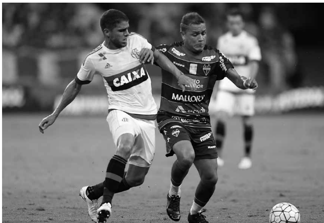
Flamengo e Fortaleza voltam a se confrontar, desta vez no Rio de Janeiro, com vantagem dos cearenses