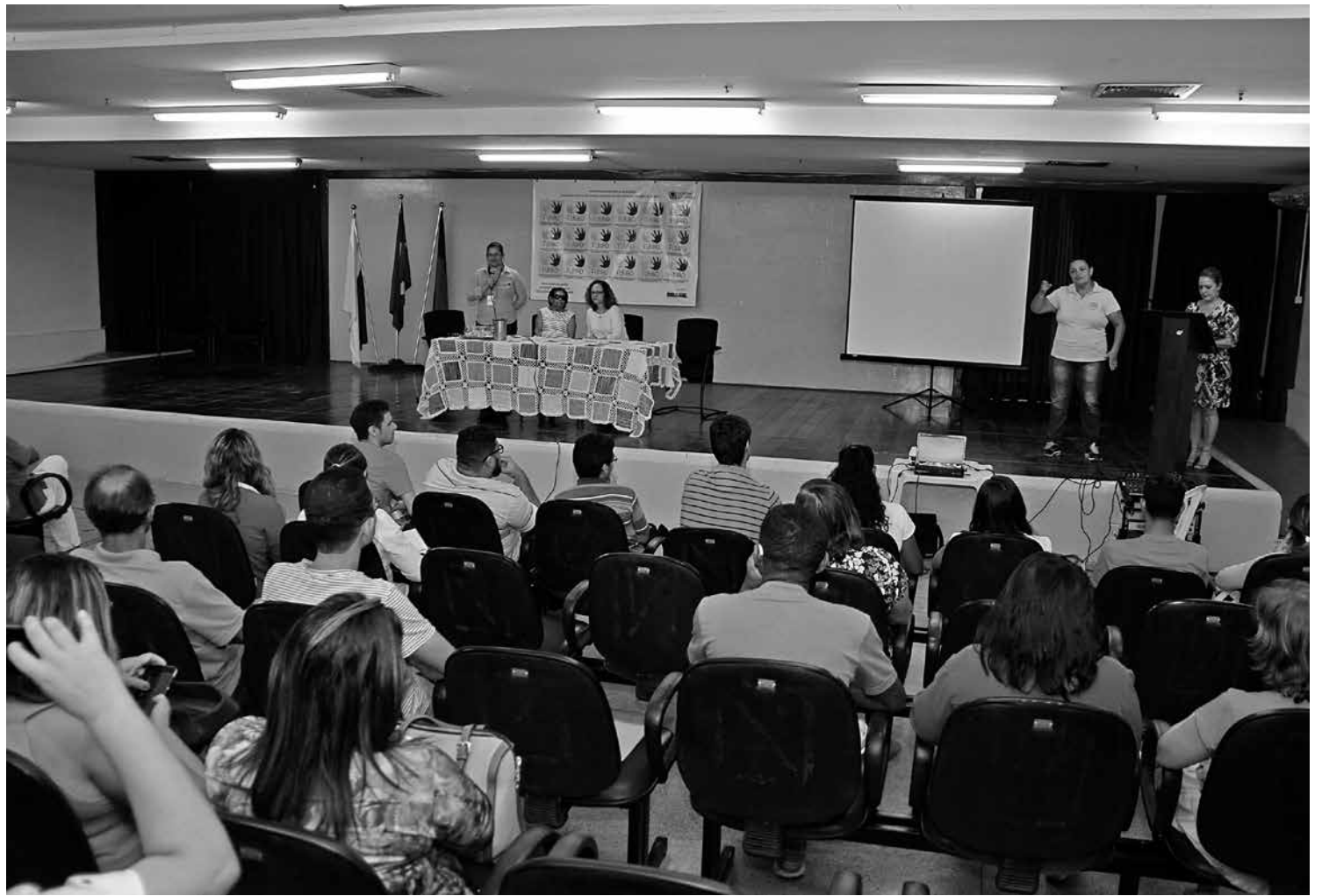
Seminário realizado no auditório da Funad reforçou a ideia de que é necessário fortalecer as parcerias para entender o mercado