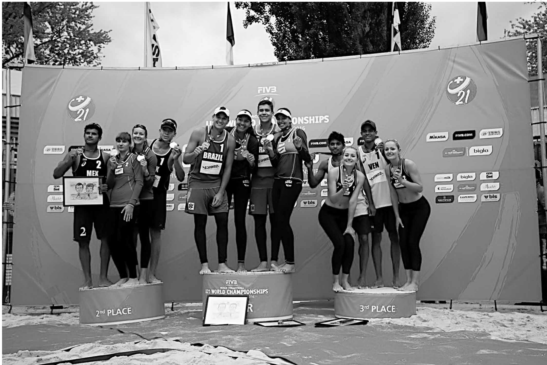
As duplas brasileiras, tanto masculina quanto feminina, ficaram em primeiro lugar no Campeonato Mundial, fazendo história para o vôlei de praia nacional