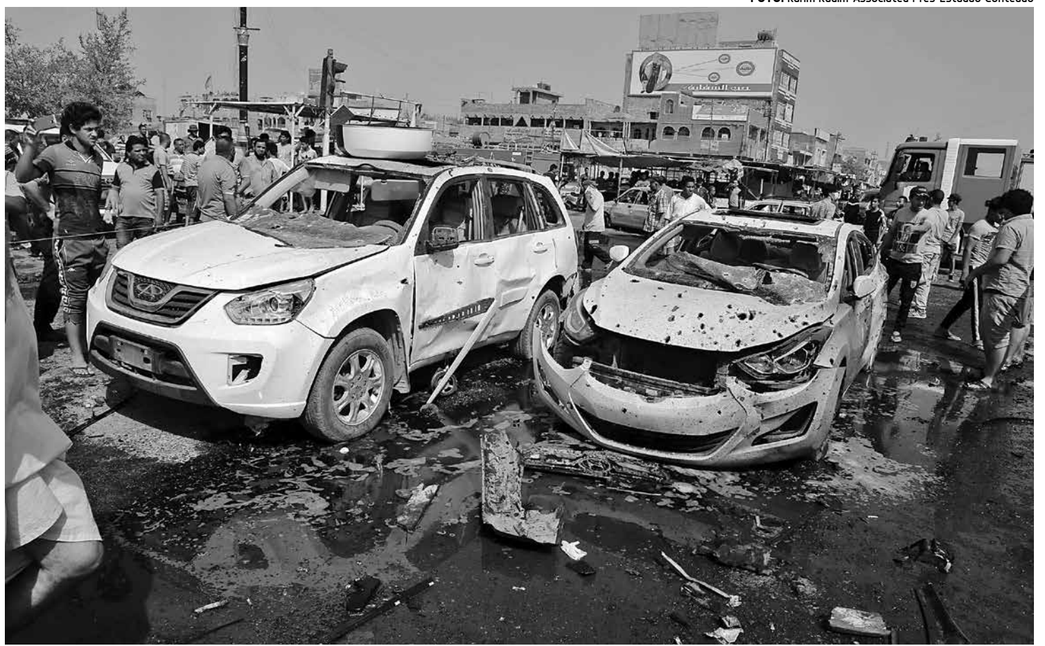
A explosão de um carro-bomba e uma série de ataques com bomba levaram medo e tensão a bairros de Bagdá, capital iraquiana

Pouco após o ataque em Shaab, um carro-bomba estacionado foi detonado no bairro de Dora, de maioria xiita, em um mercado de frutas e vegetais, no sul de