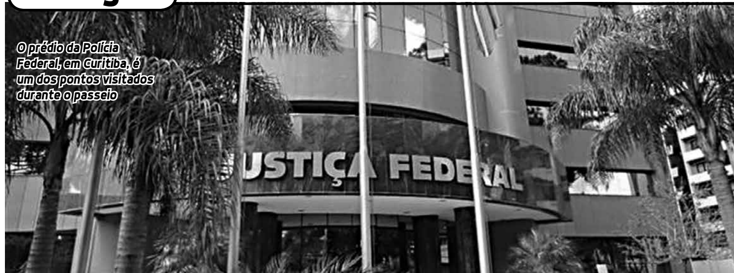
○ Prédio da Polícia Federal, em Curitiba, é um dos pontos visitados durante o passeio