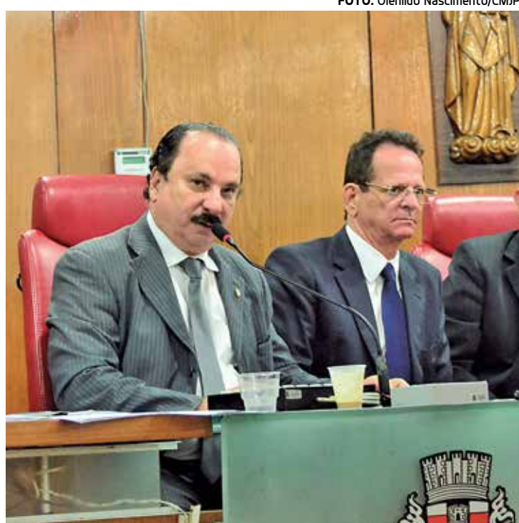
Procuradoria da CMJP será acionada para recorrer da decisão

Na semana passada, o presidente disse não acreditar na interferência do Poder Judiciário no Legislativo, mas sim que cada poder tenha sua interpretação. "Eu acredito