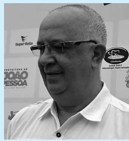
Novinho: "Belo não tem nada com isso"

Correndo por fora na expectativa de conseguir uma vaga na Série D