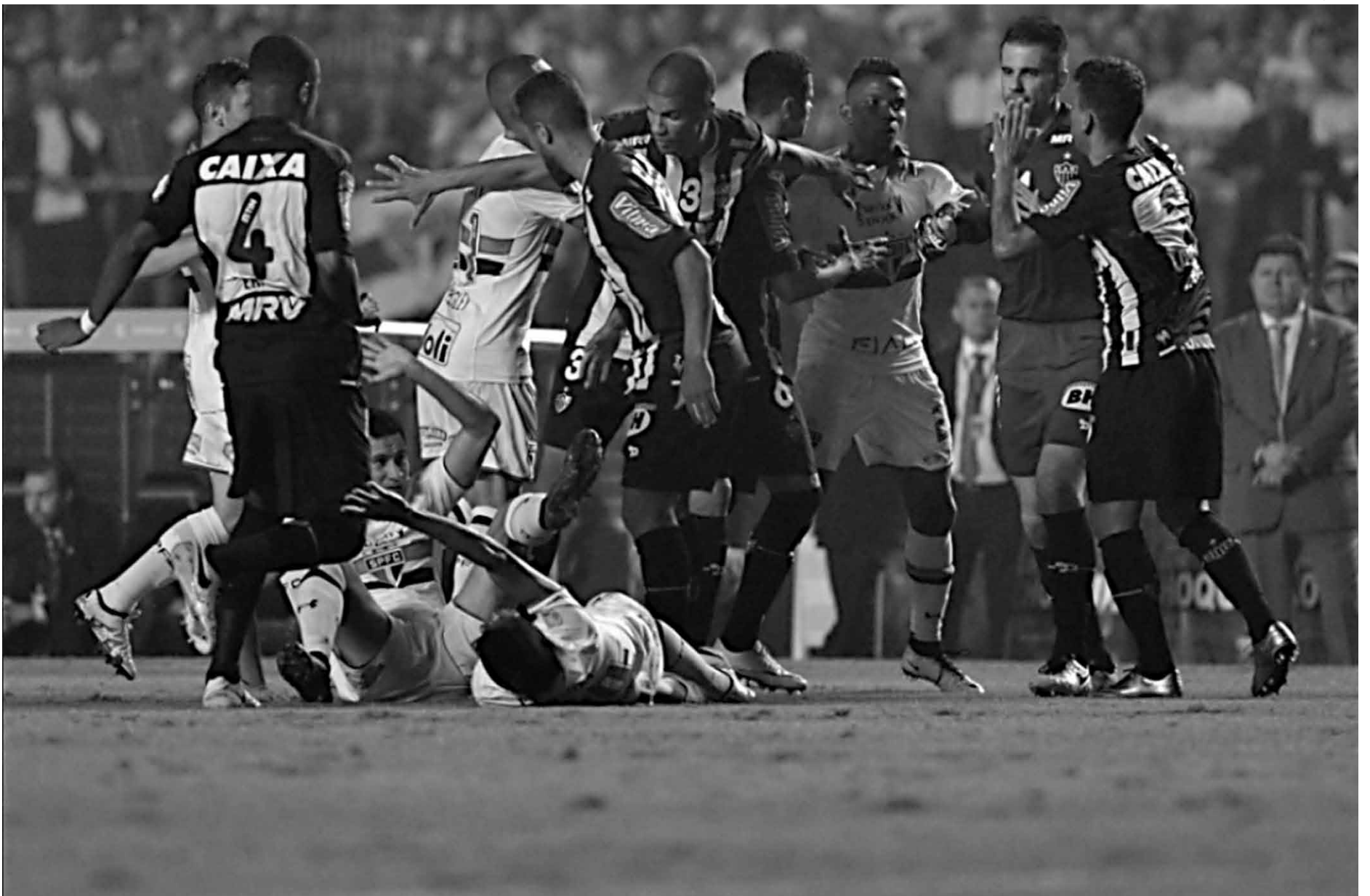
Na primeira partida, em São Paulo, o tricolor paulista venceu a equipe mineira por 1 a 0 e precisa apenas de um empate para chegar às quartas de final da competição

“É na hora. A nossa equipe não trabalhou cobrança de pênalti. Nos 90 minutos queremos sair com a classificação. Temos de fazer de tudo para não levar para as penalidades”, afirmou o camisa 23, que também disse não temer jogar no Horto.