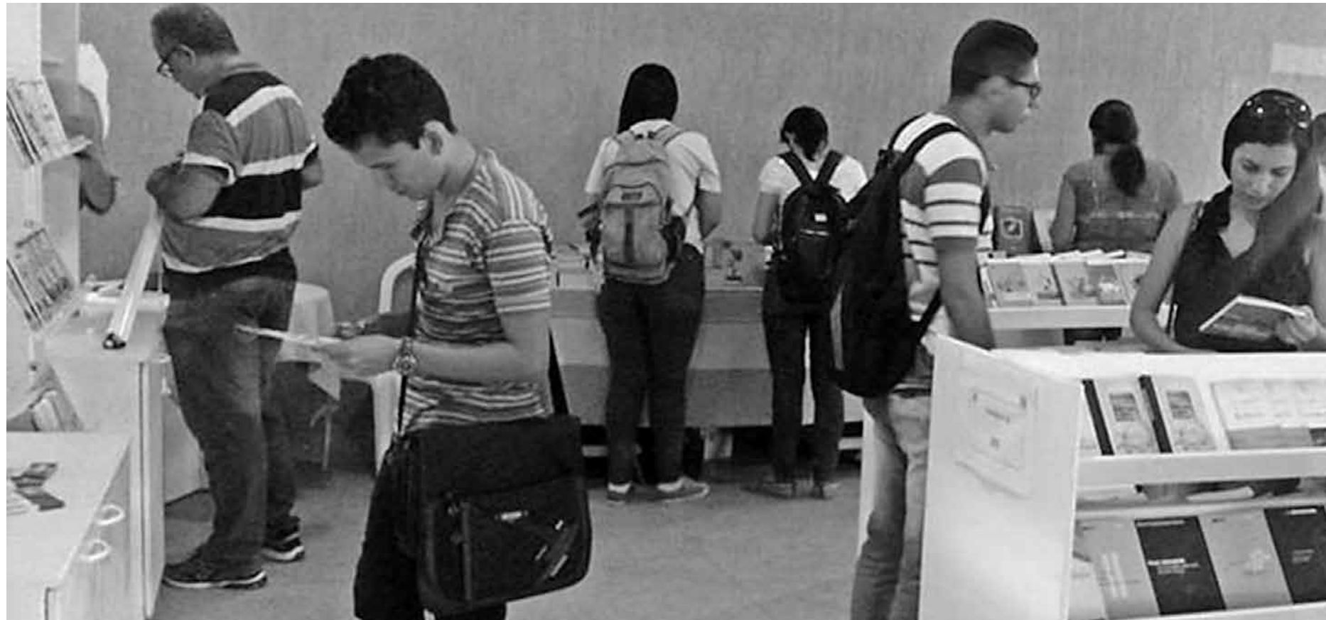
População pode adquirir por preços promocionais obras de grande qualidade nas áreas de linguística, literatura, cordel, meio ambiente, direito, esporte e sustentabilidade