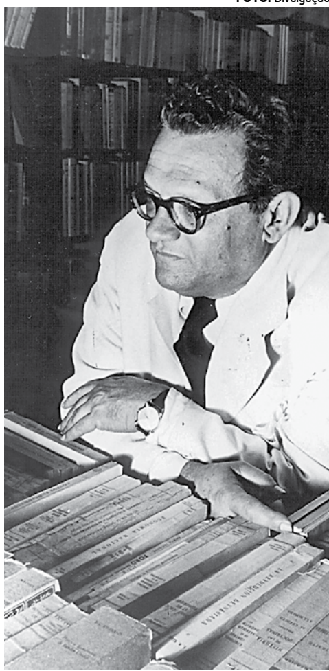
O intelectual brasileiro José Lins do Rego

O objetivo do Seminário de Estudos Literários é possibilitar a realização de um simpósio acadêmico e científico sobre a vida e obra de José Lins do Rego (1901 - 1957), discutindo questões relacionadas a diversas áreas, a exemplo da